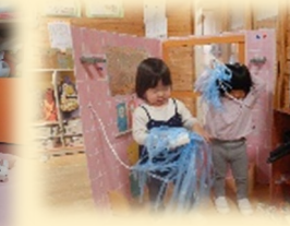
お風呂でシャワー! レストランでランチよ! ごっこ遊びや見立て遊びに夢中です♪