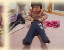
ズボンや上靴を自分で履けるようになってきましたね~