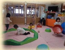
冬の時期でも保育室やホールで、のびのびと体を動かして遊んでいますよ♪