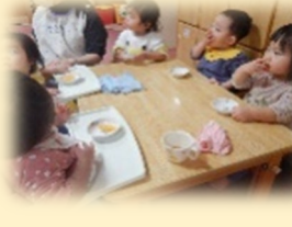
楽しみなおやつ時間♪準備が始まると、「んまんま〜」と言って待っています♡