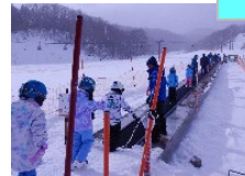
トレイン滑走もできるようになりました！