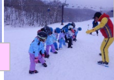
初めてのスノーエスカレーター