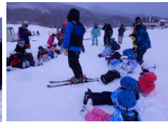
転び方も練習したよ！